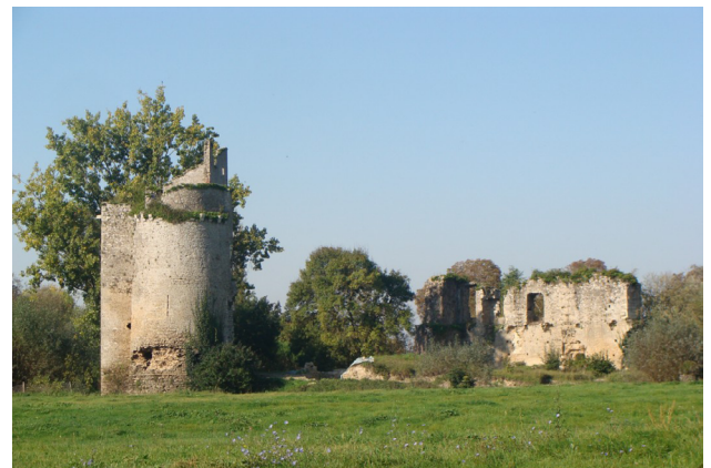
Château de Machecoul (44)

C'est à Machecoul qu'il les enferme, les torture et les tue.