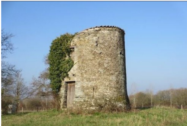
Château de Saint-Étienne-de-Mer-Morte (44)

s'emparer du Château de Sainte-Étienne-de-Mer-Morte, il moleste un membre du clergé à l'intérieur même de l'enceinte sacrée d'une église.