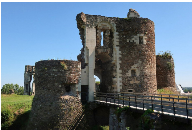
Château de Chanptocé-sur-Loire (49)

Gilles de Rais est né à Chanptocé-sur-Loire en 1404 dans un château aujourd'hui en ruines près d'Angers.