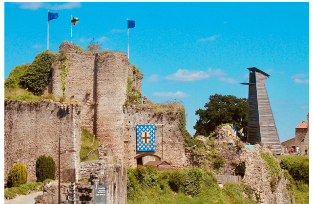
Château de Tiffauges (85)

ses caisses, se lance dans l'alchimie dans son château de Tiffauges.