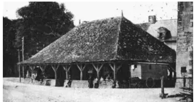
Les anciennes halles de Guipry

À Guipry , la halle est classée en 1942. En très mauvais état, son propriétaire est incapable financièrement de la restaurer. Elle est finalement déclassée pour financement impossible.