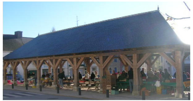
La halle à grains de Rohan

Il existait déjà une halle à Bains-de-Bretagne en 1286 au cœur du bourg sur le trajet de la route royale de Nantes à Rennes. Les bouchers s'installaient au côté sud alors que les marchands de grain occupaient le côté nord. Au début du XXème siècle, la halle-rue existait encore. Bien qu'elle soit classée, la municipalité la détruit illégalement en alertant sur son insécurité.