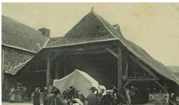
Les anciennes halles de Guémené-sur-Scorff