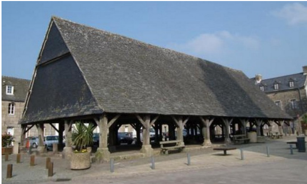
Les halles de Plouescat

On connaît une centaine de halles avant le 18ème siècle. Il y en a 5 protégées en Bretagne : Plouescat, Le Faouët, Questembert, Clisson et Rennes (les halles Martenot).