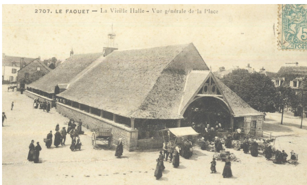
Les halles du Fauët

La grande ennemie des halles était l'humidité. Pour empêcher celle qui venait d'en haut on fabriquait de grandes toitures, souvent à croupe ou demie croupe, pour leur élégance et leur belle résistance aux intempéries. Pour lutter contre l'humidité qui venait d'en bas, on surélevait les poteaux en bois sur des dés en pierre. On pouvait aussi, comme au Fauët , les faire reposer sur des murets de pierres (qu'on appelle « mur-bahut »). Ce mur-bahut du Fauët est cependant particulièrement haut. D'autres halles possédaient des poteaux de granite.