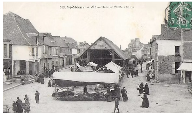
Les anciennes halles de Saint-Méen

La Bretagne suit le mouvement. Pontivy par exemple détruit ses halles en 1848 pour l'hygiène. À St-Méen on détruit les halles en 1908 en raison des normes d'hygiène et dans le but d'élargir les rues pour la circulation automobile. Cette destruction a occasionné le tirage de toute une collection de cartes postales.