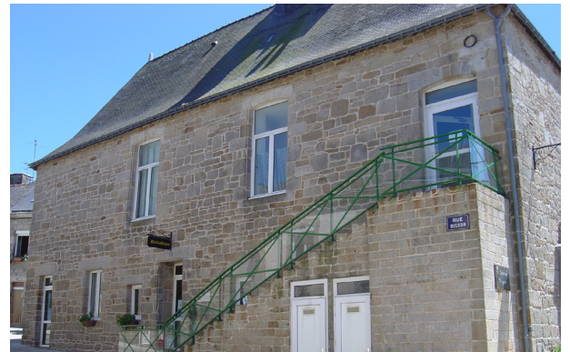
L'ancien auditoire de justice + halles de Guémené

L'auditoire de justice était souvent placé dans les halles, à l'étage, comme ce fut le cas à Guémené-sur-Scorff . Après tout, les halles et l'auditoire avaient le même responsable local, c'est-à-dire le seigneur. La disposition de l'auditoire était souvent la même : la salle de jugement était à l'étage, celle destinée au public au rez-de-chaussée, il n'y avait pas cloison entre les deux. Les entrées étaient différentes. À Montcontour, les halles, tout en étant petites, comportaient un auditoire.