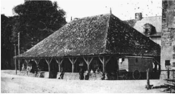
Les anciennes halles de Guipry

Certaines des premières halles avaient la forme d'une croix. Elles étaient construites par des bâtisseurs d'églises.