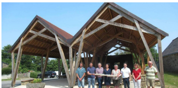
Les nouvelles halles de Troguéry

Lorsqu'on en construit, les halles nouvelles redeviennent des lieux de commerce et d'échanges comme à Troguéry (22).