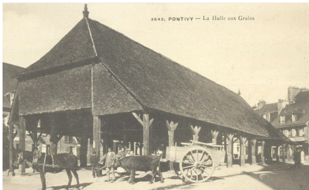
Les anciennes halles de Pontivy