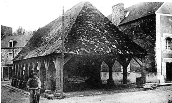
Les anciennes halles de Rohan

Rohan possédait 2 halles : celle aux étoffes, bâtie entre 1450 et 1460, aujourd'hui disparue et celle au grain, construite entre 1682 et 1700. En 1947, malgré son inscription aux Monuments Historiques, la halle fut illégalement démontée et vendue. Elle servit de hangar agricole dans une commune voisine pendant plus de 50 ans et risquait de disparaître définitivement lorsque grâce à une association, Idée Halles, la halle fut restaurée et réinstallée au cœur de Rohan en 2007. Aujourd'hui elle abrite un marché hebdomadaire dédié aux produits du terroir.