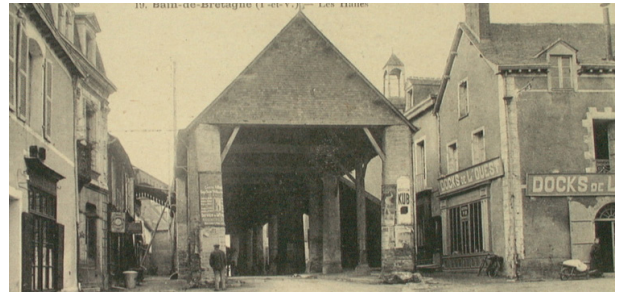
La anciennes halles de Bains-de-Bretagne

Il existait déjà une halle à Bains-de-Bretagne en 1286 au cœur du bourg sur le trajet de la route royale de Nantes à Rennes. Les bouchers s'installaient au côté sud alors que les marchands de grain occupaient le côté nord. Au début du XXème siècle, la halle-rue existait encore. Bien qu'elle soit classée, la municipalité la détruit illégalement en alertant sur son insécurité.