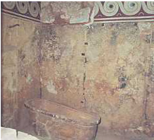
Salle de bain du Roi Minos en Crète, -2000 av.J.C

La salle de bain est aujourd'hui un incontournable de nos maisons. Mais comment en est-on arrivé là ? La salle de bain n'a pas toujours été une évidence et l'usage qu'on en faisait un but purement hygiénique. En 3000 av.J.C, à Mohenjodaro, au Pakistan, l'ancienne civilisation de la Vallée de l'Indus, a créé le premier bain public de l'antiquité. Il s'agissait alors d'une sorte de grand bain utilisé pour purifier le corps et l'esprit avant une cérémonie religieuse. Il faut encore patienter un millénaire pour voir apparaître les salles de bain. La plus ancienne est celle du Roi Minos, en Crète. C'est encore aux Grecs, aux Égyptiens et aux Romains que nous devons l'invention de la robinetterie, des thermes, des étuves et des bains publics. Les plus riches avaient déjà des salles de bains privées.